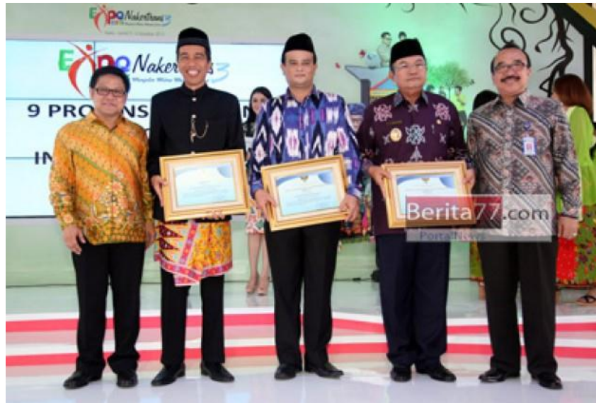
Wakil Gubernur Kalimantan Tengah Menerima Penghargaan Indeks Pembangunan Ketenagakerjaan Tahun 2013

Nilai Indeks Pembangunan Ketenagakerjaan ini dapat dijadikan bahan evaluasi Pemerintah Pusat maupun Pemerintah Daerah. terhadap kebijakan dan program ketenagakerjaan yang telah diterapkan. Pengukuran Indeks Pembangunan Ketenagakerjaan ini dilakukan sejak tahun 2011. dan Provinsi Kalimantan Tengah menunjukkan perkembangan Indeks Pembangunan Ketenagakerjaan yang menggembirakan.